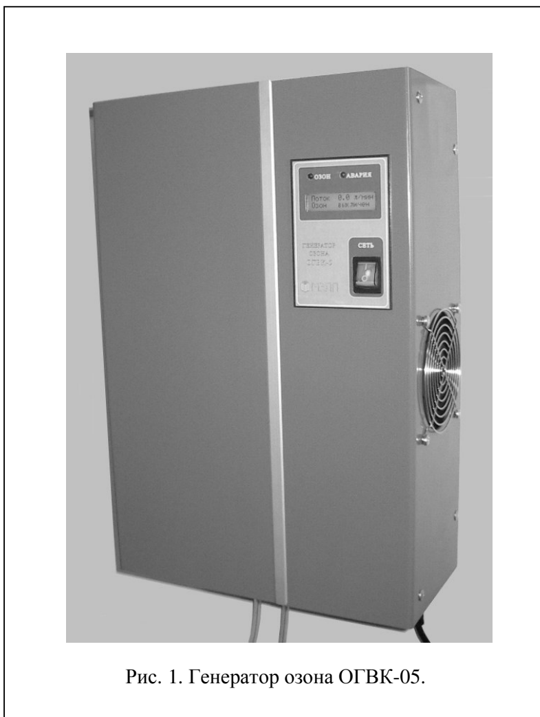
Рис. 1. Генератор озона ОГВК-05.

В озонаторах ОГВК-05** используется традиционный способ получения озона в газовом разряде барьерного типа. Охлаждение газоразрядного реактора осуществляется окружающим воздухом. Основной отличительной особенностью озонаторов является использование “интеллектуального” источника питания, автоматически поддерживающего оптимальную газоразрядную мощность в широком диапазоне расходов, давлений и температур питающего газа. Поток питающего газа (осушенный воздух или кислород) через озонатор обеспечивается внешним побудителем расхода (эжектор, компрессор или кислородная магистраль).